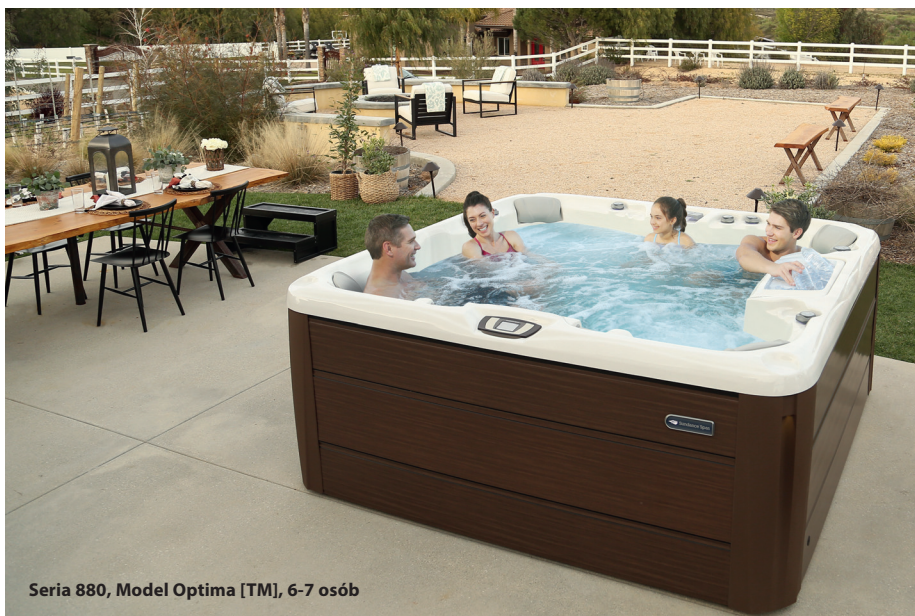
Seria 880, Model Optima [TM], 6-7 osób

Od 40 lat wyznaczamy międzynarodowe standardy w dziedzinie designu, technik hydroterapii oraz technologii produkcji. Mamy się czym chwalić – Sundance Spas® posiada w swojej kolekcji zarówno jedne z najdroższych jacuzzi na świecie, jak i modele znacznie bardziej ekonomiczne, które łączy ten sam kunszt wykonania. Nasze urządzenia są efektem wieloletnich badań i prac zespołu inżynierów i technologów oraz doświadczeń użytkowników. Na rynku spa, Sundance Spas® to marka pięciogwiazdkowa, z przedstawicielstwami w 70. krajach. Taka renoma