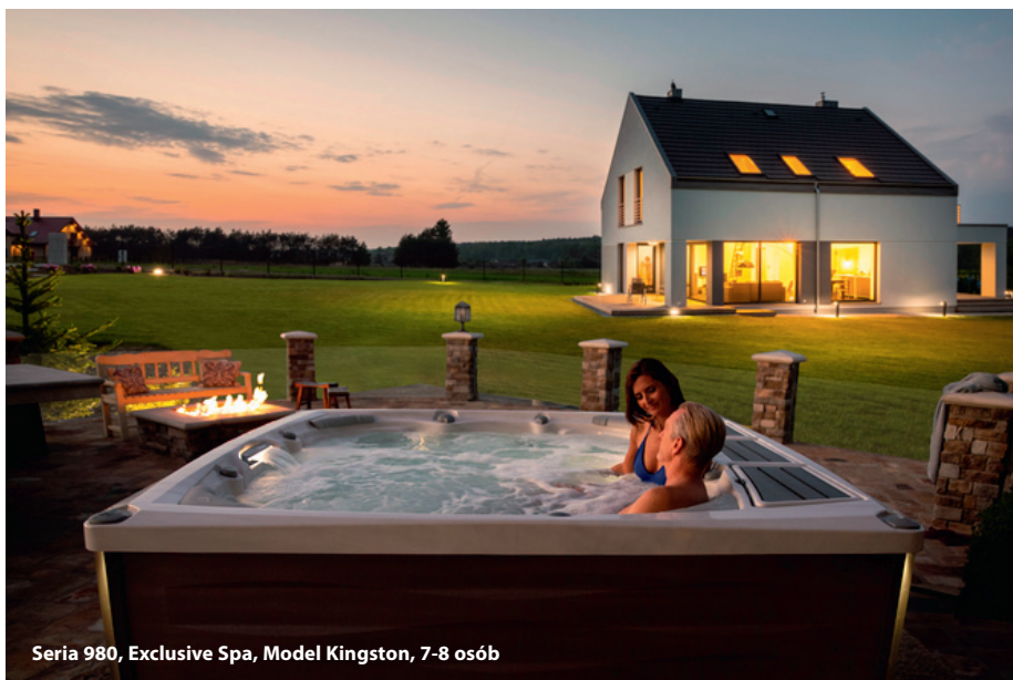
Seria 980, Exclusive Spa, Model Kingston, 7-8 osób