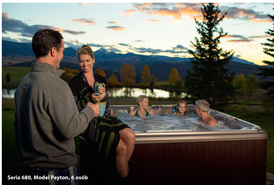
Seria 680, Model Peyton, 6 osób