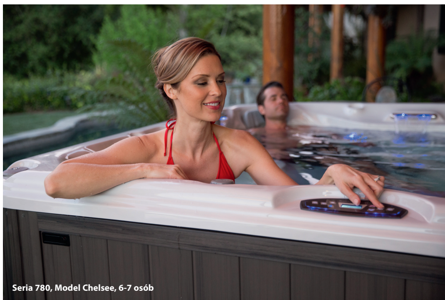
Seria 780, Model Chelsea, 6-7 osób